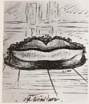
172 Naissance de l'ameublement paranoïaque. c. 1937

Meuble Illustration pour « La Vie secrète de Salvador Dalí » encre sur papier Collection particulière