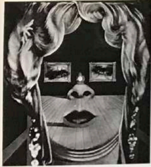
170 Détail cf. n° 208